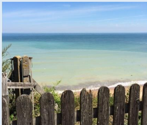
Enjoy a clifftop walk or explore the sandy beaches