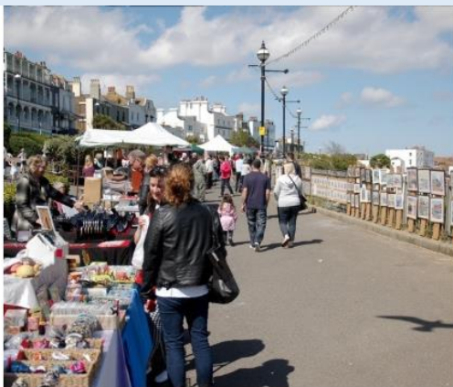
Stroll along the promenade eating fish and chips.