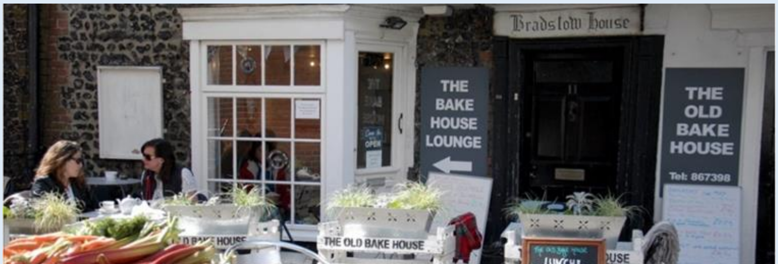
Eat in one of the many sandwich shops, cafés and delicatessens in the town centre.