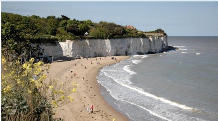
Try a swim in the sea - refreshing!