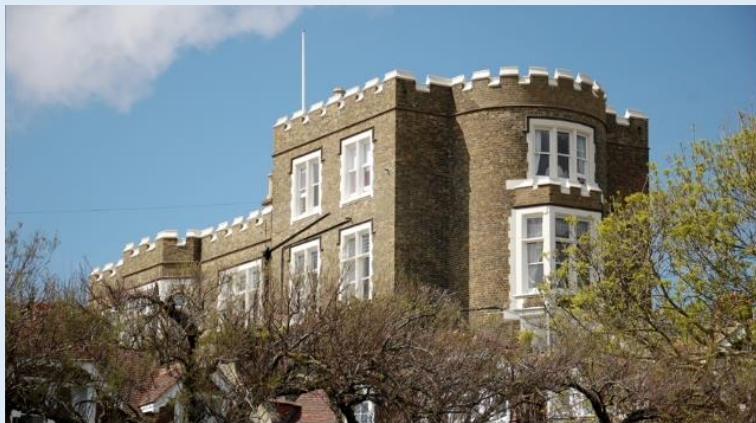
Visit Bleak House to find out more about Charles Dickens, who spent many happy summers in Broadstairs